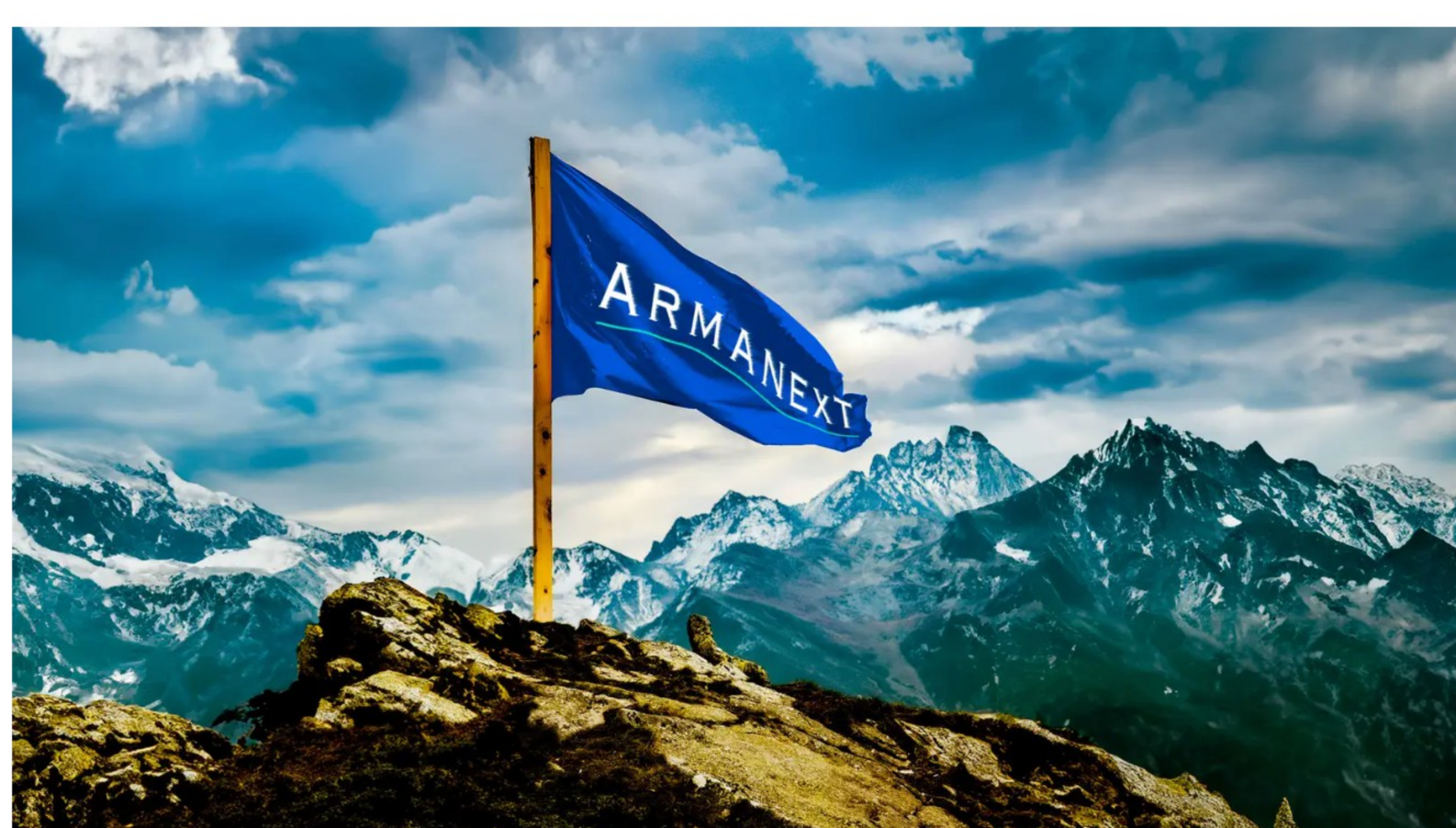
Al igual que los Sherpas acompañan las expediciones, ARMANEXT guía a las empresas desde el campamento base del proceso de cotización hasta el toque de campana en los mercados ARMANEXT